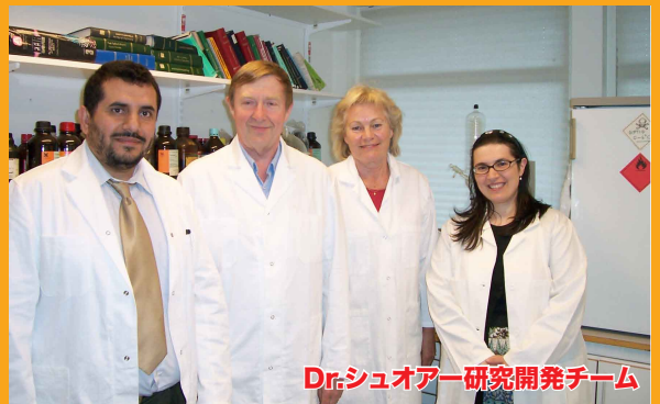
Dr.シュオアー研究開発チーム

Dr.シュオアーは、NewpharmaresearchABという権威ある研究機関を運営しており、特にハーブを使った処方には定評があり、多くの特許を取得しております。