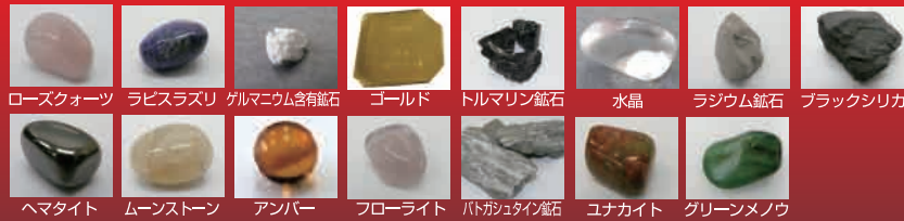
ローズクォーツ ラピスラズリ ゲルマニウム含有鉱石 ゴールド トルマリン鉱石 水晶 ラジウム鉱石 ブラックシリカ ヘマタイト ムーンストーン アンバー フローライト パルガシタイ鉱石 ユナカイト グリーンメノウ