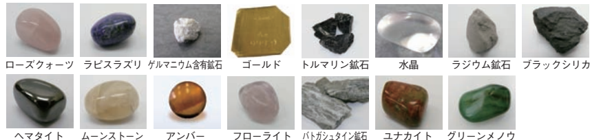
ローズクォーツ ラピスラズリ ゲルマニウム含有鉱石 ゴールド トルマリン鉱石 水晶 ラジウム鉱石 ブラックシリカ