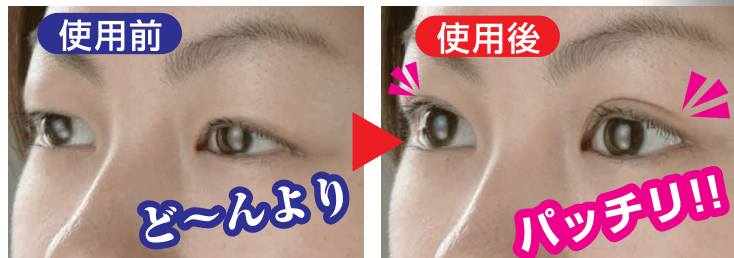
老けて見える重たい目